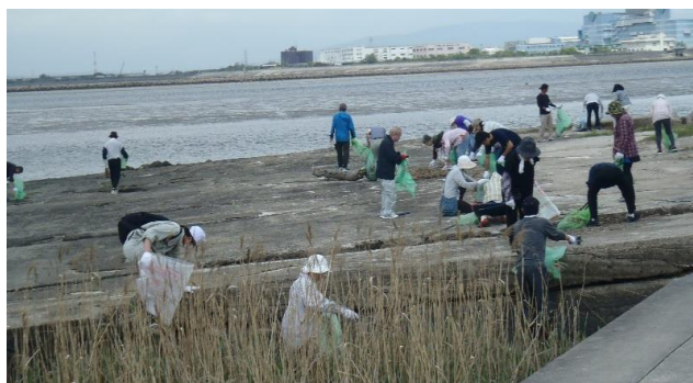
地元学区9会場に518名参加(稲永・野跡会場)