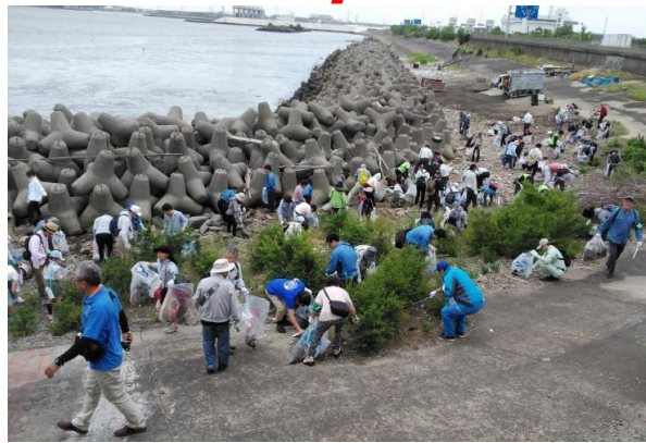
392名の参加があった藤前会場