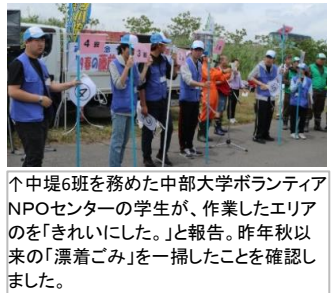
↑中堤6班を務めた中部大学ボランティアNPOセンターの学生が、作業したエリアのを「きれいでした。」と報告。昨春秋以来の「漂着ごみ」を一掃したことを確認しました。