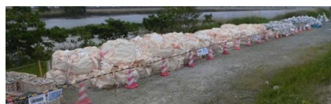
↑庄内川河川事務所の維持管理で収拾したごみ