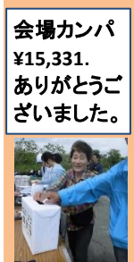
会場カンパ ¥15,331. ありがとうございました。