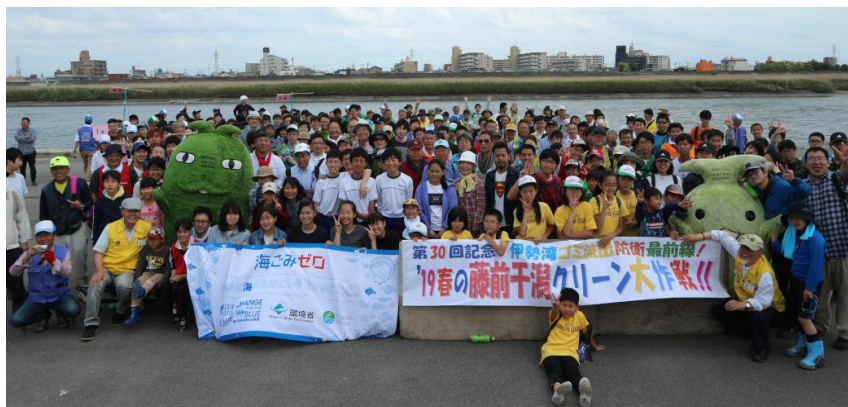
1,129袋拾った中堤会場(揚土場広場)には604名参加