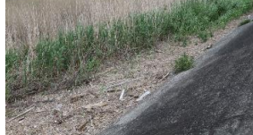
↑きれいになった川岸