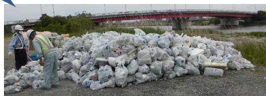
←中堤で拾ったペットボトル・可燃ごみの山