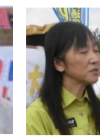
環境省酒向統括自然保護企画官