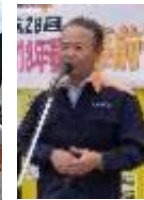
直江県議会議長挨拶