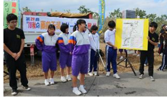
↑北陵中・笠原中・中部大学による水質調査発表