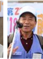
坂野実行委員長挨拶