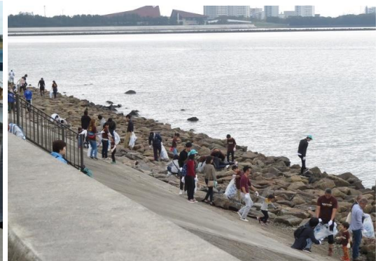
375名の参加があった藤前会場