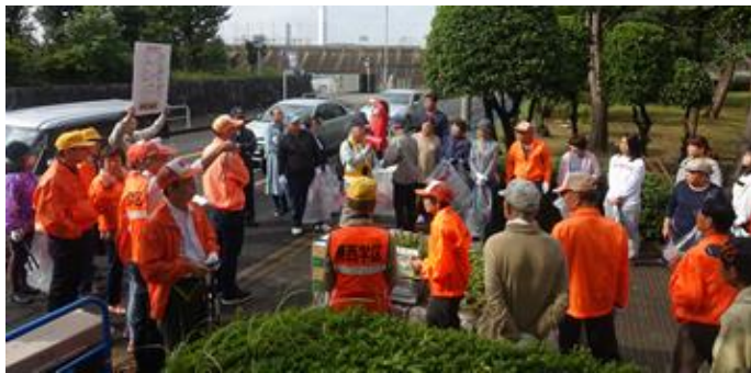
地元学区会場に355名参加(港西学区には162名)