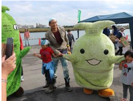
↑モリコロはみんなの人気者