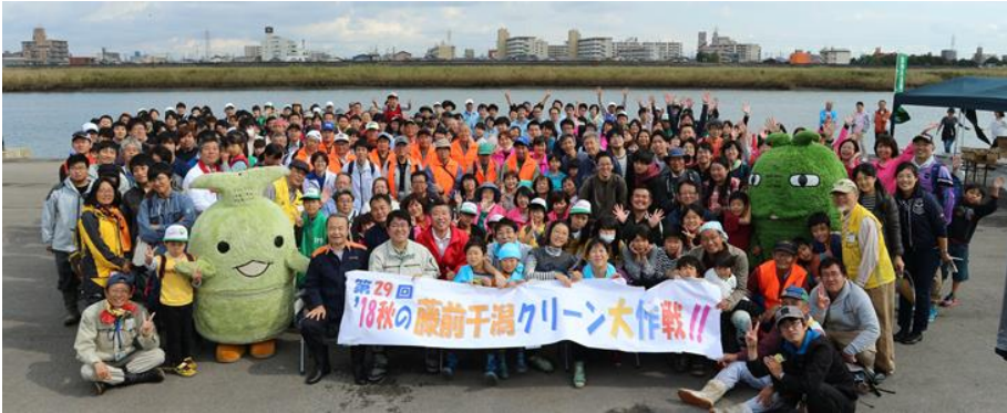
1,400袋拾った中堤会場(揚土場広場)には441名参加