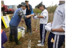
←中部大学の学生と多治見市の中学生が大活躍！