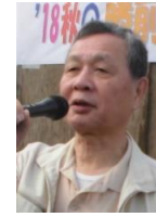
中川医師が「無理しないで！」