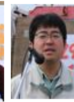
国交省西庄内川河川事務所長