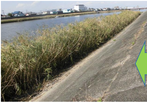
きれいになりました。