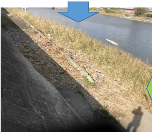
きれいになりました。