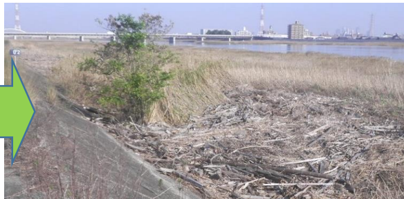
庄内川河川事務所の維持管理できれいになりました。