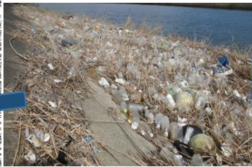
少し残ってしまいました。