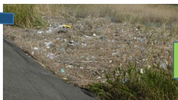
殆ど手がついていません。