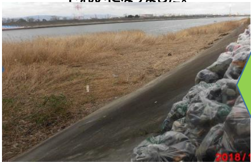
きれいになりました。