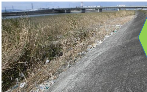
全くの手つかずです。