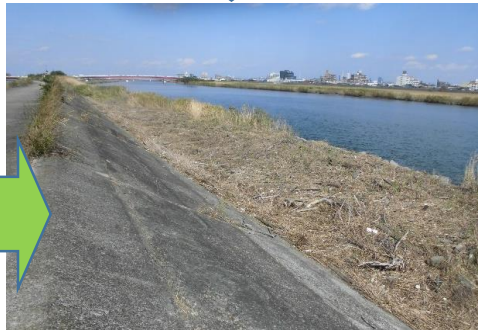
きれいになりました。