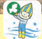
清流ミナモの未来づくり登録事業

吉崎海岸ではNPO法人四日市ウミガメ保存会が「ウミガメのふるさと四日市」をスローガンに2009年1月から吉崎海岸で毎月海岸清掃や自然に関する勉強会を行っています。私たちも吉崎海岸の活動や意見交換を通じて、伊勢湾流域の環境を考え豊かな伊勢湾を実現する活動を進めていきましょう。